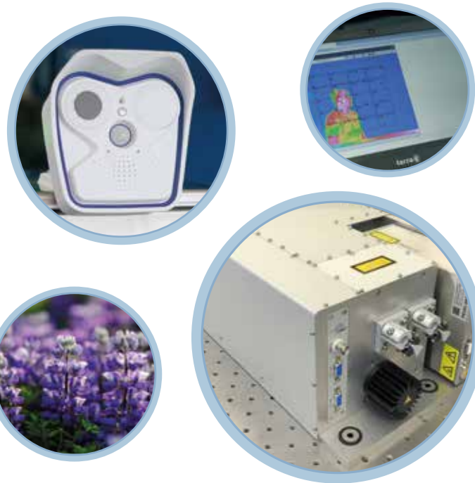
Diese Fotos zeigen ausgezeichnete Produkte der vergangenen Jahre.