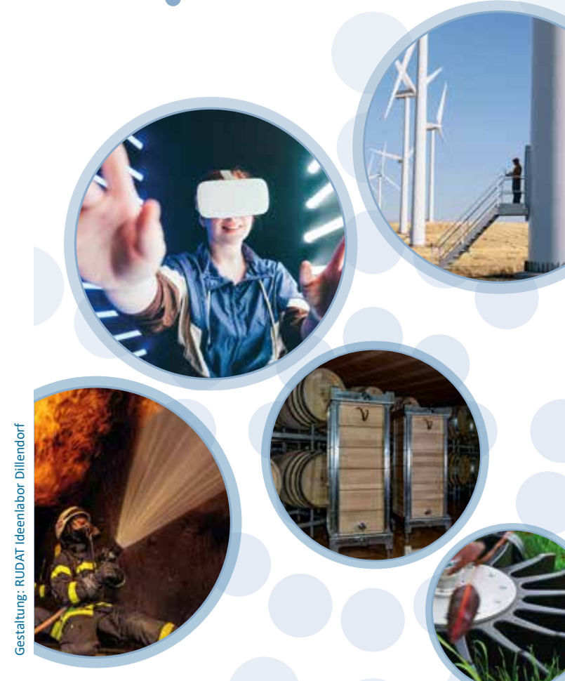
Gestaltung: RUDAT Ideenlabor Dillendorf